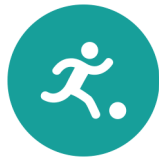
Spel en beweging/ bewegingsonderwijs